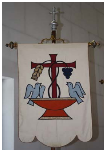
Cafanun pign dretg