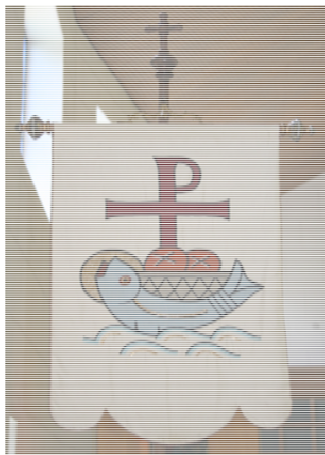
Cafanun pign seniester